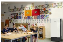
Foto 1: Sorgt für ein gutes Raumklima und verringert das Infektionsrisiko durch Viren in Schulbetrieb und Kita: einer von drei neuen Luftreinigern Miele AirControl.