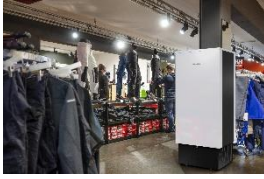
Foto 2: Braucht wenig Platz: ein Luftreiniger Miele AirControl, der sich auch dort bewährt, wo keine Fenster verfügbar oder diese schwierig zu öffnen sind.